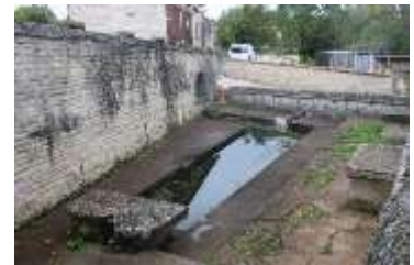
La montée vers le vieux village de Bourrier